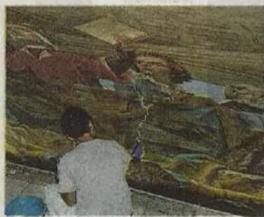
CONSOLIDAMENTO E PROTEZIONE SOFFITTO AFFRESCATO - SALA CIAMPI