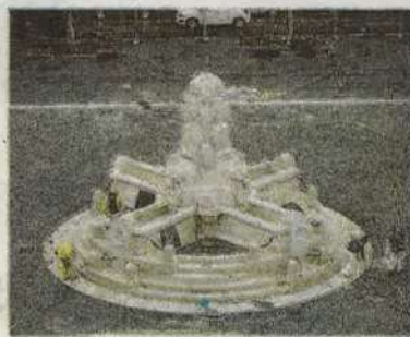
TRASFERIMENTO FONTANA DELLE ANFORE A PIAZZA TESTACCIO - ROMA

gestione dei cantieri, e una a Bari, come punto di dislocamento per tutti gli interventi da effettuare nel Sud. Infine una terza sede oltre i confini nazionali è stata aperta a Bucarest, in Romania, per la gestione dell'ufficio locale da cui si dipanano i diversi incarichi: tutto il paese.