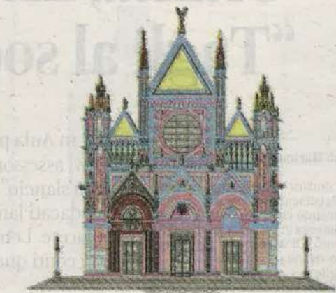
PROGETTAZIONE E DIAGNOSTICA DEL DUOMO DI SIENA

il Gruppo Pouchain è stato impegnato in oltre 5 mila commesse legate all'edilizia generale, ai restauri monumentali, alla diagnostica, alla progettazione e,