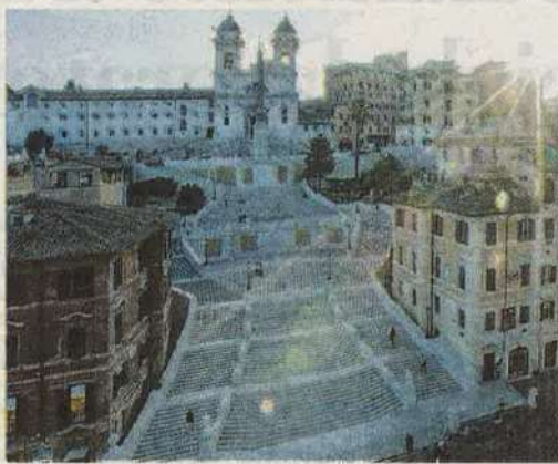
RESTAURO DELLA SCALINATA DI PIAZZA DI SPAGNA - ROMA

Perciò, a partire dagli anni '80, il Gruppo stesso ha deciso di dotarsi di un laboratorio di diagnostica con l'obiettivo di utilizzare tale tecnica principalmente per le attività di restauro monumentale, e in particolare