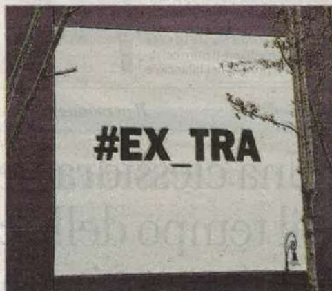
IL LOGO DI #EX-TRA